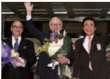
( ) IMC